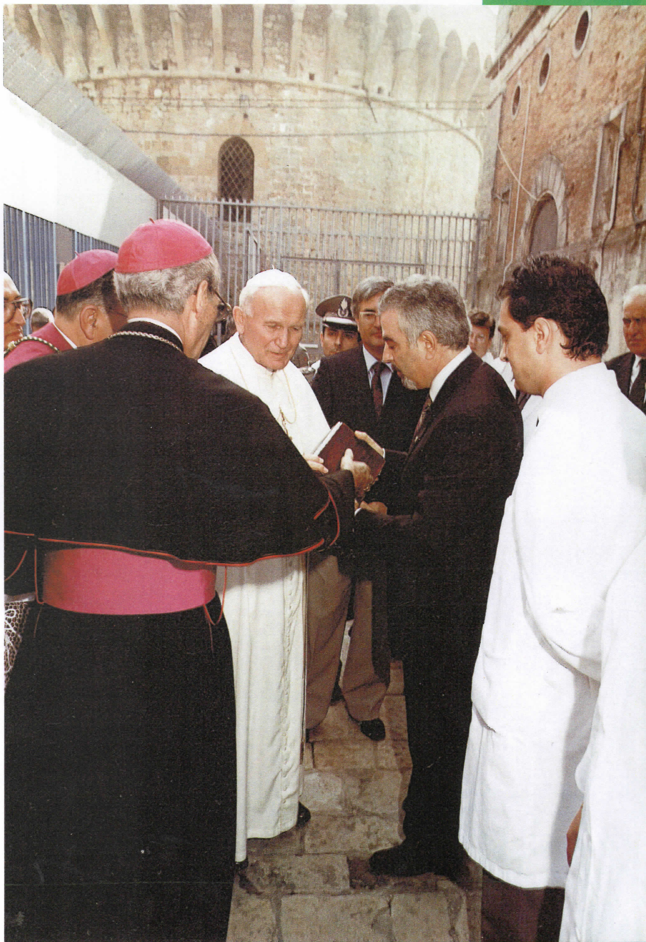
Incontro con il Sommo Pontefice Giovanni Paolo II al Carcere di Volterra