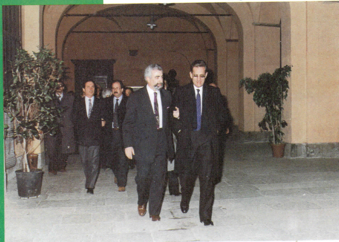
Aula Magna «La Sapienza» dell'Università degli Studi di Pisa – 1989