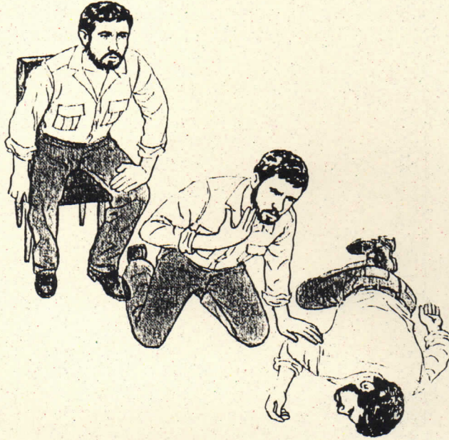
Insorgenza dello stato di shock.

Responsabilità professionale .Responsabilità assistenziale.